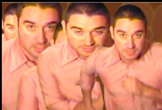
11 - MIDNIGHT MADNESS (6mn35) Soirée surréaliste et dada. Réalisation: Marc Pellerin et Mathieu Garnero (Grasse) LES EDITIONS DU COBRA