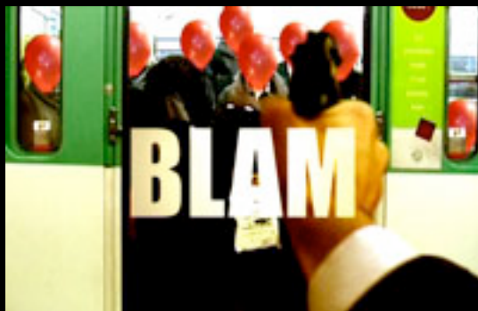
14 - LE BONHEUR EST EN PROMO (3mn33) Auto-fiction et humour noir. Réalisation: REVEL-MOUROZ Antoine (Paris)