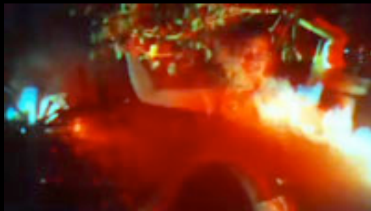
29 – FIRE BALLS (5mn28) La poésie des jongleurs de feu. Réalisation: Jean-Marie Minazio