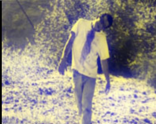
9 - LA FIN D'UN REGNE (6mn19) Réflexion sur la condition d'être humain. Réalisation: Franck-Olivier Martin (Brest)