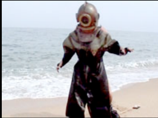
13 - SAUVONS ROBINSON (18mn57) Un Robinson des temps modernes, en mer Caspienne. Réalisation: Philippe Pasquini (Paris)