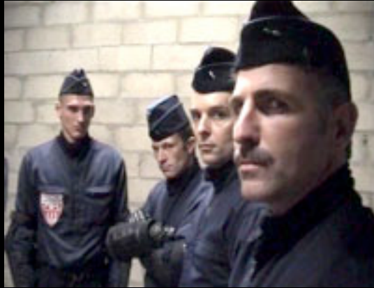
12 - FUNKY CRS (30s) No comment... Réalisation: KOURTRAJME (Paris)