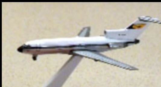
22 - EDITION JOURGUEIL (50 sec) Publicité pour un nouveau jeu à la mode. Réalisation: La cause