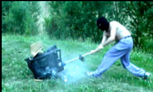
23 - REMONTE TES CHAUSSETTES (3mn30) Défonce, rythme et cagoules. Réalisation: La cause