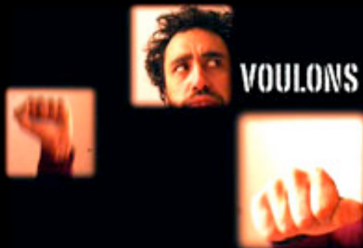
26 - T'es IN t'es BAT (6mn45) Le célèbre collectif activiste est de retour. Réalisation: David Lepolard / Guéric Perves