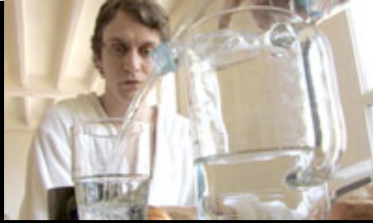
27 – EKOLOPATHE (4mn40) L'écologie, mode d'emploi. Réalisation: Julien David