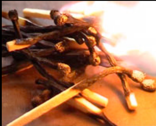
10 - IBM (5mn28) Vidéo-clip nuageux. Réalisation: Franck-Olivier Martin (Brest)